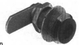
Medidas en mm

Cerradura con palanca Symo 3000 para núcleos de cilindro que se introducen por delante por parte del usuario.