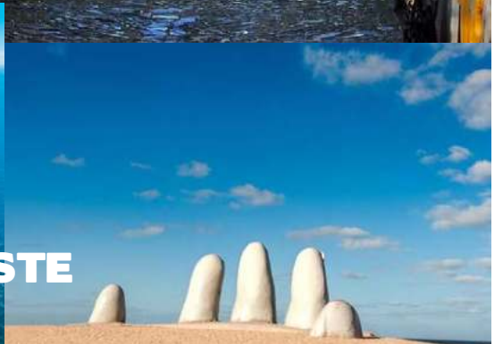
PUNTA DEL ESTE